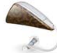
Delta in Originalgröße

Delta ist praktisch unsichtbar zu tragen: Das Gerät verschwindet hinter der Ohrmuschel. Einen Schallschlauch gibt es nicht mehr, sondern nur noch ein haardünnnes Kabel - denn der Lautsprecher von Delta sitzt im Gehörgang! Das sieht nicht nur gut aus, sondern bietet vor Allem einen tollen Klang.